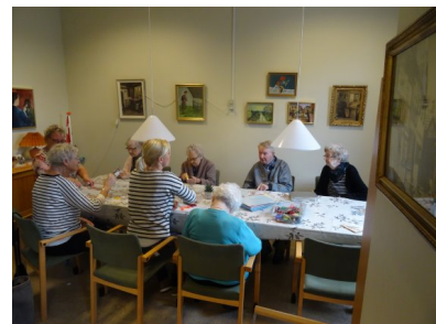
In een van de ruimtes van het Byhuset wordt geknutseld