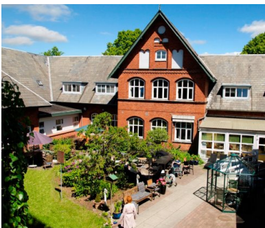
Het inloophuis voor dementiepatiënten en hun naasten in Odense, Denemarken